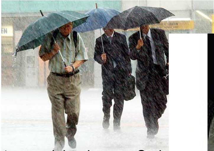
I tre uomini arrivano a Sodoma